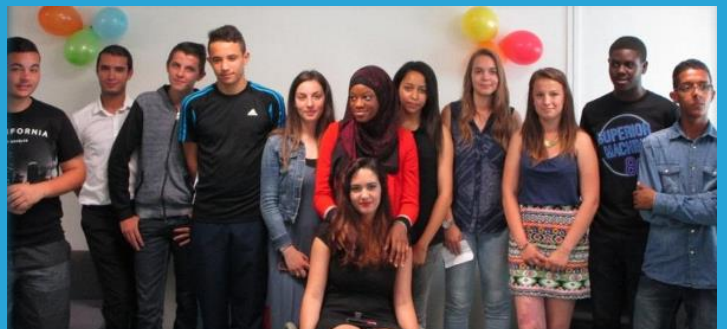
La CJS Jeun'SCOP de Saint-Herblain (2015)