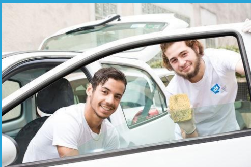
Lavage de voiture à la CJS de Saint-Sébastien